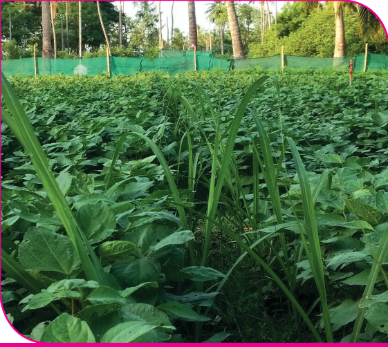
கரும்பு + உளுந்து