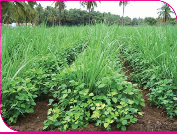
கரும்பு + தட்டைப்பயறு

ஊடுபயிர் சாகுபடி என்பது நிலப்பயன்பாடு, நேரப்பயன்பாடு, தீவிரப்பயிர் சாகுபடி, அதிக வருமானம் போன்ற பயன்களுடன், அதிக வேலை வாய்ப்பையும் தரவல்ல ஓர் சிறந்த தொழில்நுட்பமாகும். மேலும், இது இடுபொருட்களைத் திறம்பட பயன்படுத்தவும், விவசாயிகளுக்குத் தேவையான பல்வேறு வகை உணவுப் பொருட்கள் உற்பத்தி செய்யவும், அதிக இலாபம் ஈட்டவும் உதவுகின்றது. இத்துடன், ஊடுபயிர் சாகுபடி முறையில் கரும்பைத் தாக்கும் கரிப்பூட்டை நோயின் நோய் பரப்பும் காரணிகளின் இயக்கத்தைக் குறைத்து, அந்நோயின் தாக்குதலைக் குறைக்கவும் இயலும். கரும்பில் சோயாபீன்ஸ் ஊடுபயிர் செய்யும் போது கரும்பின் தரம் சிறந்து விளங்குவதாக பல்வேறு ஆராய்ச்சி முடிவுகள் தெரிவிக்கின்றன.