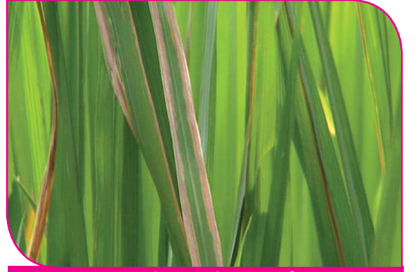
நெல் நுண்ணுயிர் இலைக் கருகல்நோய்

தமிழ்நாட்டில் பயிரிடப்படும் முக்கிய தானியப் பயிர்களான நெல், சோளம், கம்பு, மக்காச்சோளம் ஆகியவை பலவிதமான விதை மூலம் பரவும் நோய்களால் தாக்கப்பட்டு, அதிக விளைச்சல் இழப்பு ஏற்பட காரணமாயிருக்கிறது. நெற்பயிரைத் தாக்கும் செம்புள்ளி நோய், குலை நோய், நெற்பழ நோய் மற்றும் பாக்கீரியா இலைக் கருகல் நோய் போன்றவையும், சோளப்பயிரில் சூழ்ந்த கரிப்பூட்டை நோய், தலைக்கரிப்பூட்டை நோய் போன்றவையும், கம்பு பயிரில் அடிச்சாம்பல் அல்லது பசுங்கதிர் நோய், கரிப்பூட்டை மற்றும் தேனொழுகல் நோய் போன்றவையும், மக்காச்சோளத்தில் அடிச்சாம்பல் நோயும் விதைகளை தாக்குவதுடன் விதைவழி பரவி நோயை ஏற்படுத்தும். சோயாபீன்ஸில் தோன்றும் தேமல் நோய், எள்ளில் ஏற்படும்