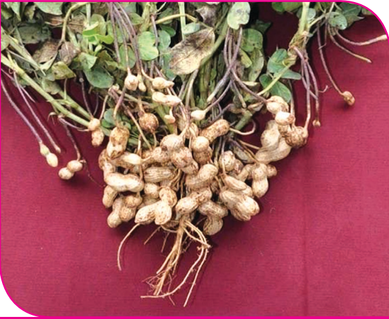
இலை வழி உரம் தெளிக்காத பயிர்

அல்லது மிகவும் முதிர்ச்சியடைந்த காய்களை காலம் தாழ்த்தியோ அறுவடை செய்வது விதைத் தரம் மற்றும் விளைச்சலை பெருமளவில் பாதிக்கும்.