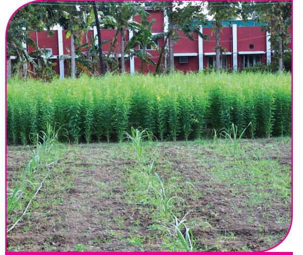
கரும்பு + சணப்பு

காய்கறிப்பயிர்கள் - வெண்டை, வெங்காயம், தக்காளி, கொத்தமல்லி, கீரை வகைகள்