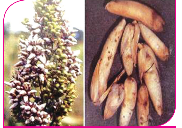
சோளம் - சூழ்ந்த கரிப்பூட்டை, மூடியகரிப்பூட்டை நோய்