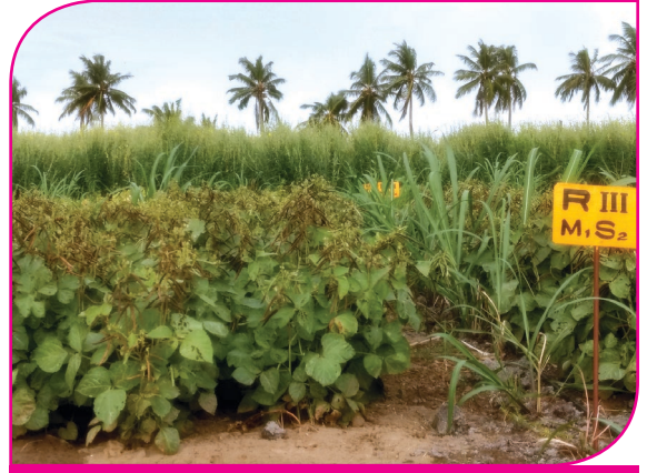
கரும்பு + பாசிப்பயறு