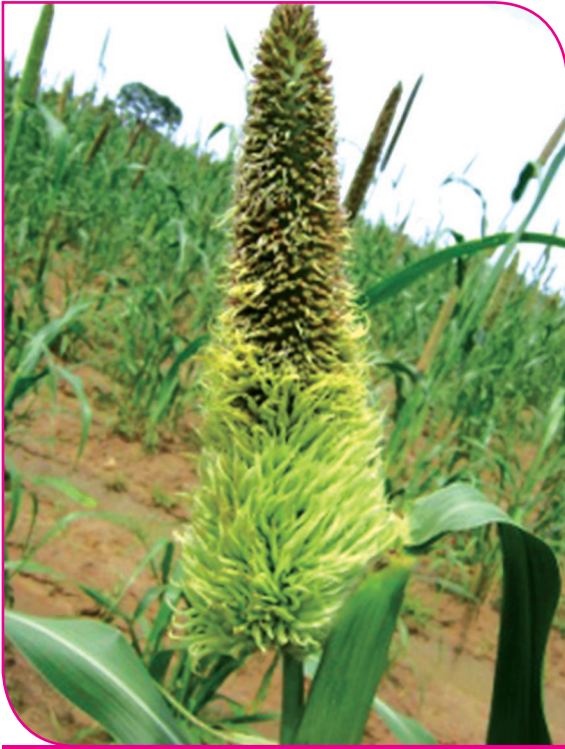
கம்பு - மென்சாம்பல் நோய், பசுங்கதிர் நோய்

இலைப்புள்ளி நோய், மிளகாயில் தோன்றும் பழ அழுகல் நோய் போன்றவை விதை வழி பரவும் நோய்களாகும்.