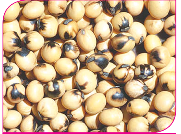
சோயாபீன்ஸ் தேமல் நோய்

காணப்படும். மேலும், நிலத்திற்கு இயற்கை உரங்களை இடுவதால் அவை மண்ணில் வாழக்கூடிய நன்மை பயக்கும் நுண்ணுயிர்களைப் பெருகச் செய்யும்.