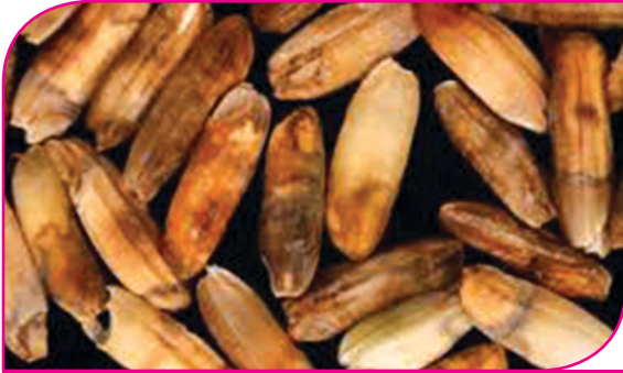
நெல் செம்புள்ளி நோய்