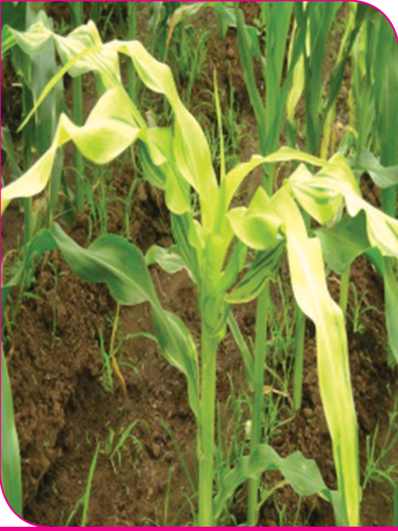
மக்காச்சோளம் மென்சாம்பல் நோய்

வேண்டும். இவ்வாறு செய்வதன் மூலம் நோய்க் கிருமியின் அடர்வை குறைக்க முடியும்.