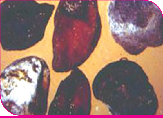
கொண்டைக்கடலை ஆஸ்கோகைட்டா நோய்

புளுரசன்ஸ் ஒரு கிலோ விதைக்கு 10 கிராம் என்ற அளவிலும் விதை நேர்த்தி செய்வதனால் விதை மூலம் பரவும் நோய்களைக் கட்டுப்படுத்தலாம்.