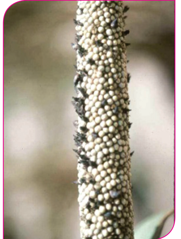
கம்பு தேனொழுகல் நோய்