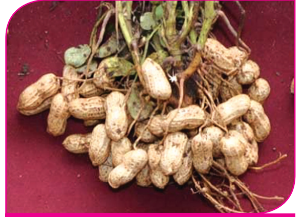
நாப்தலின் அசிடிக் அமிலம் (200 பிபிஎம்)

உற்பத்தி செய்யப்பட்ட விதைகளை உடனே விற்பனை செய்ய முடியாமல் இருக்கும் பொழுது விதைகளை சேமித்து வைக்கலாம். விதை உற்பத்தி செய்வதில் எவ்வளவு கவனம் தேவையோ, அதே அளவு கவனம் விதைகளை அடுத்த விதைப்புப் பருவம் வரை சேமித்து வைப்பதிலும் தேவைப்படுகிறது.